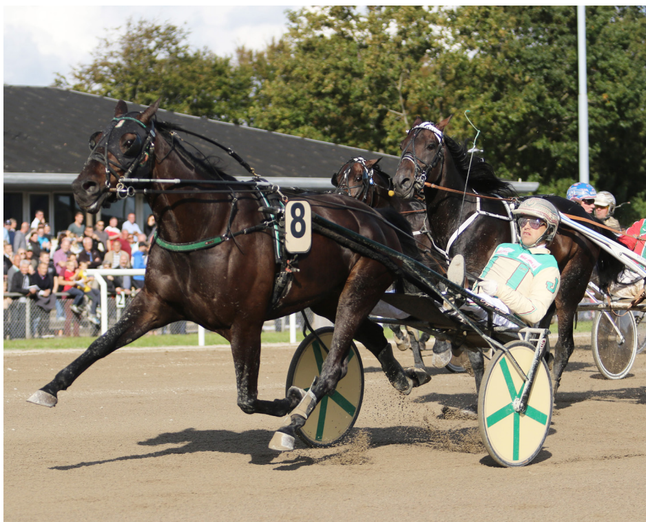
Tripolini V/P var klart bedst i Liga 1-finalen og er helt klar til VM-løbet International Trot i USA 14. oktober.