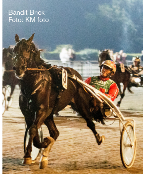
Bandit Brick