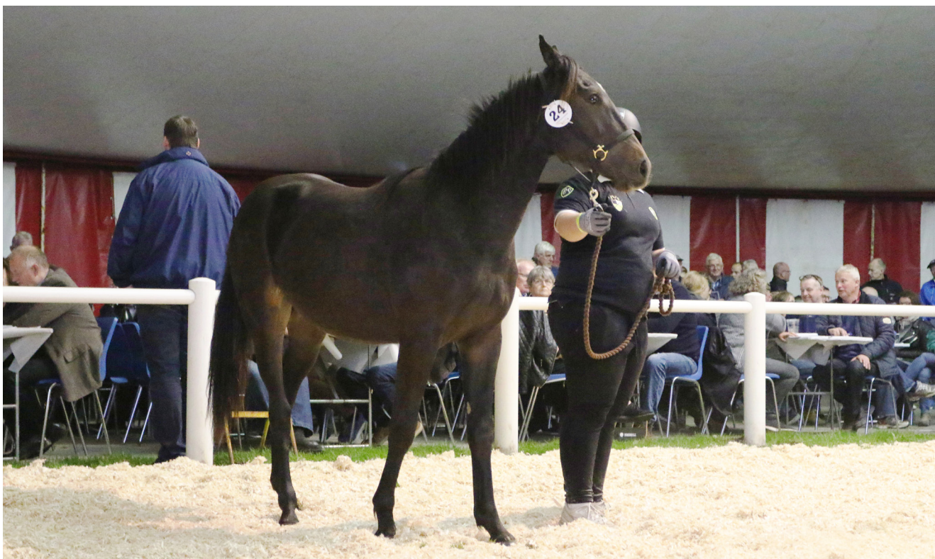
Avlshingsten Wishing Stone er hot for tiden, og var i øvrigt hovedsponsor for Aalborg Store Pris og Aalborg Hoppechampionat i år. Her fremvises katalognummer 24 Eurostone, som blev solgt for 77.000 kr. til Stald Sotto.