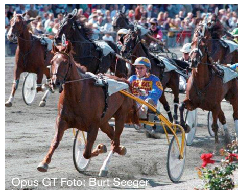
Opus GT