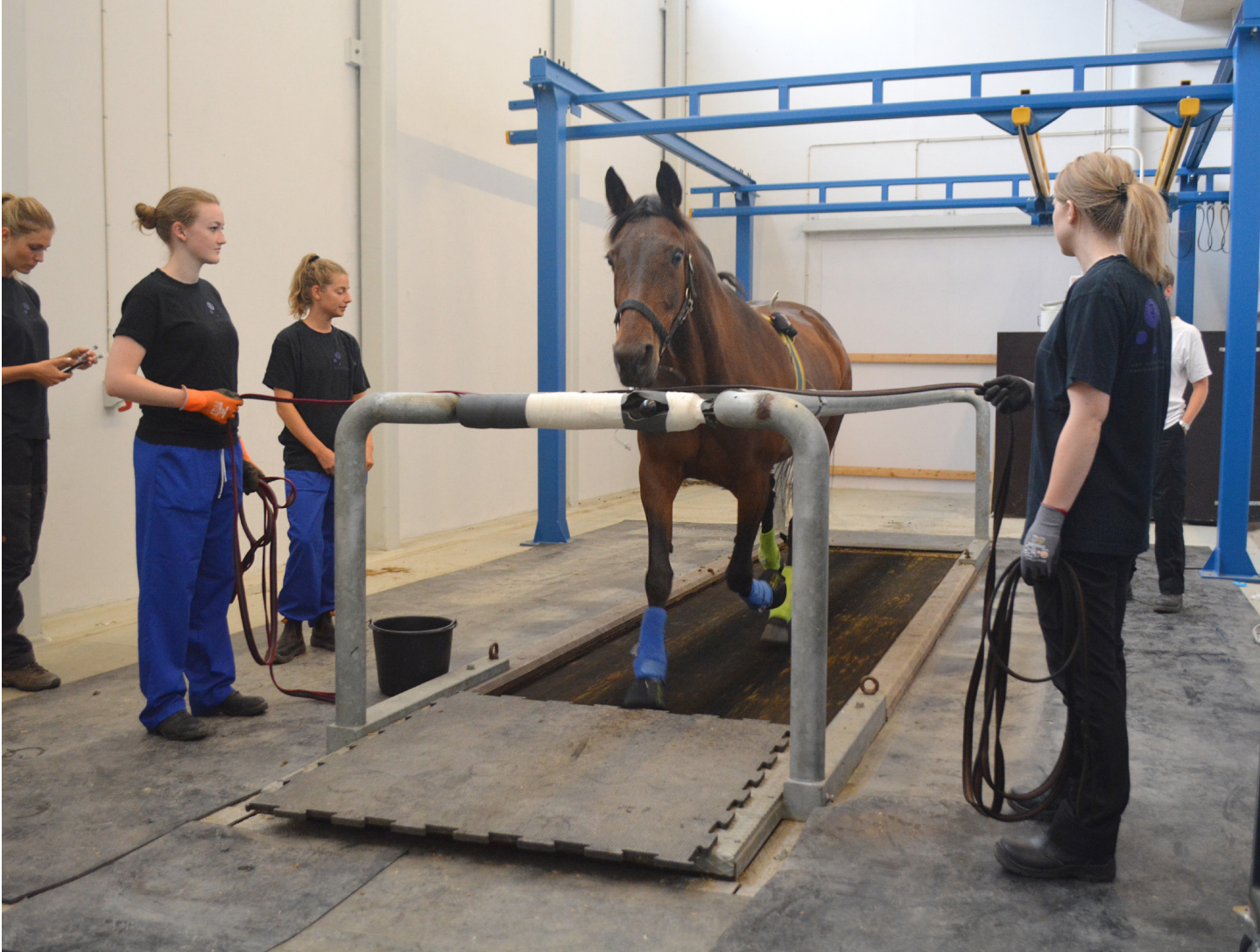
En hest trænes på løbebånd.

rigeligt dækket. Når hesten derimod begynder at arbejde, og behovet for ilt til kroppens celler stiger, så får det en betydning, at hjertet ikke længere effektivt kan pumpe blodet rundt, og vi ser en hest, der bliver hurtigere træt.