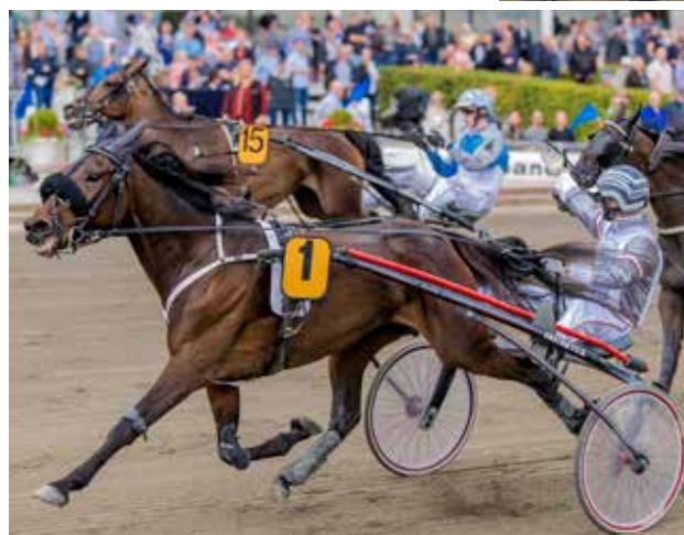
Team Andersen efter sejren til Cassiopeia i Hoppe Derby Consolation.