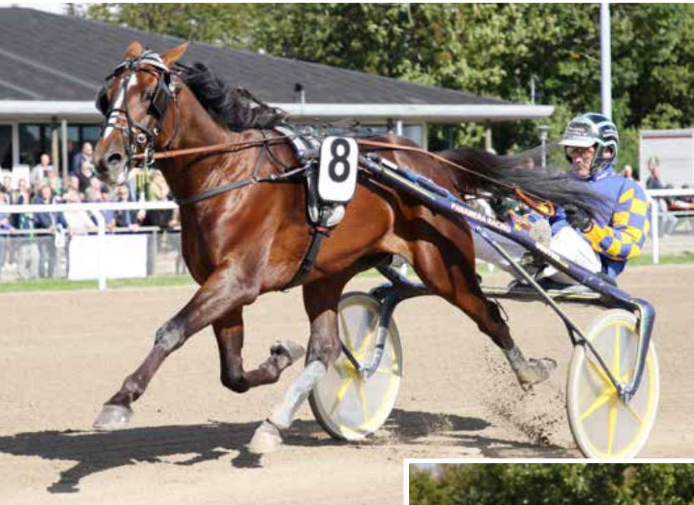
Opdræt fra Panamera Racing vandt begge auktionsløb. For hingste vandt Eric The Eel, mens Eenymeenymymoe tog sig af hoppernes løb.