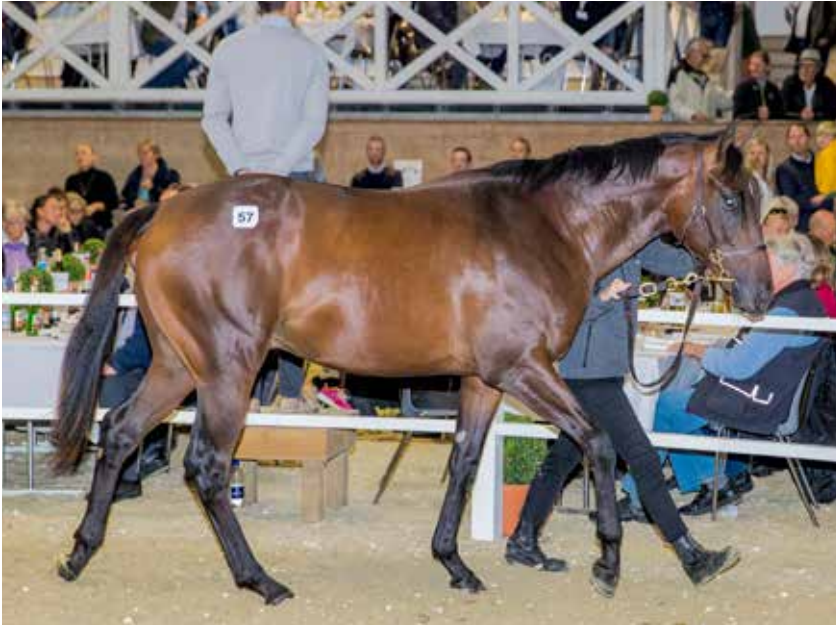
Dyreste åring på Scandinavian Open Yearling Sale blev en hingst efter Wilshire Boulevard og Gift From The Sea . York Stutteri fik hammerslag på 575.000 kr. Karin Salling købte.

Tekst: Henrik Brendholdt