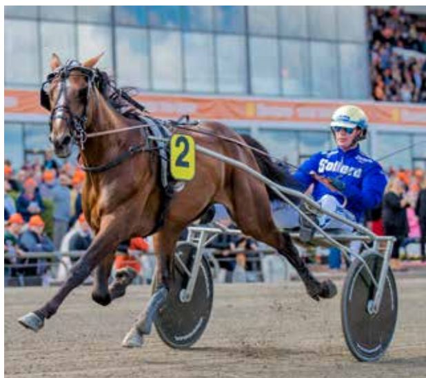
Eric The Eel vinder overlegent i Derbyweekenden, og fremstår som en af Danmarks bedste 2-åringer.