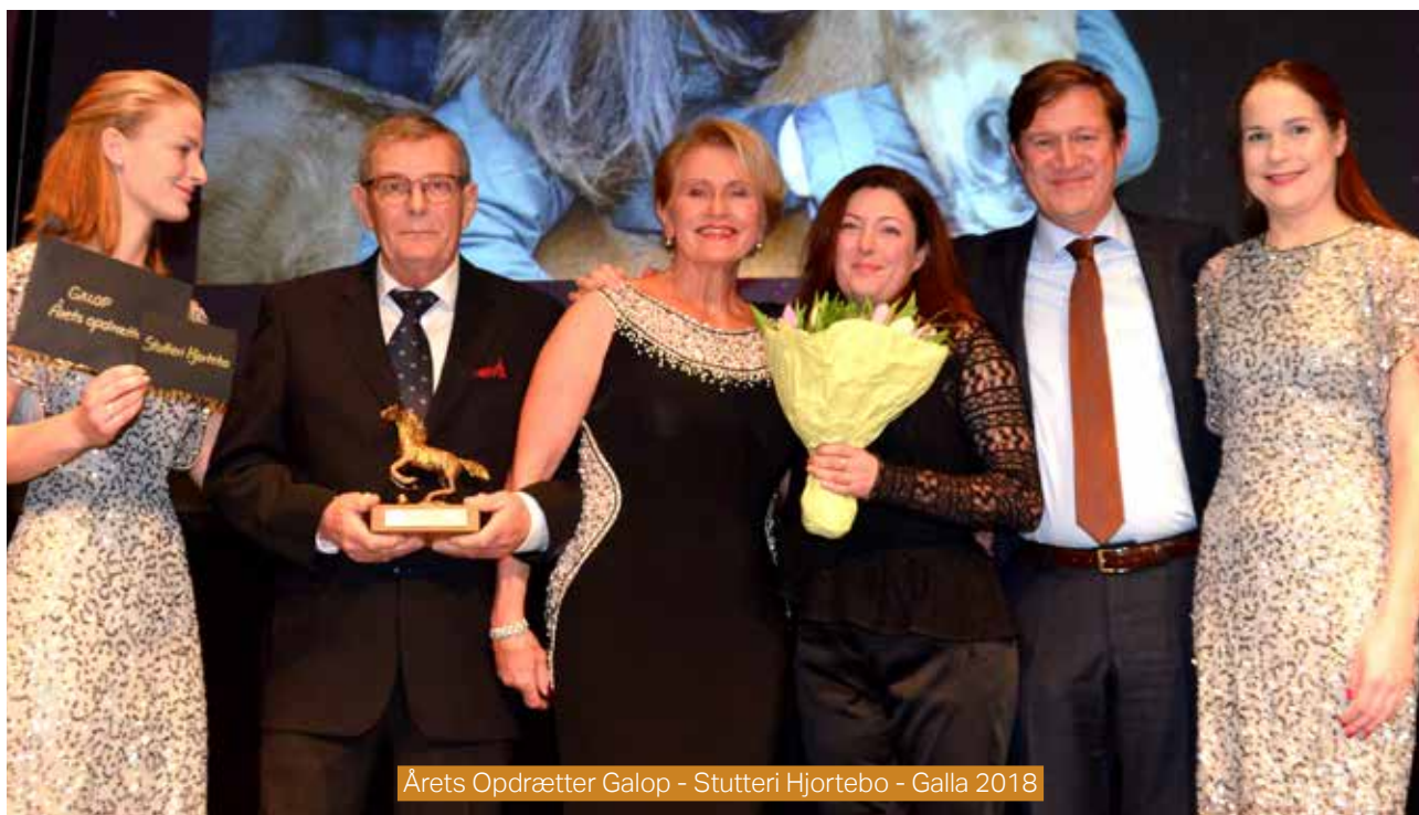
Årets Opdrætter Galop - Stutteri Hjortebo - Galla 2018

3-14-årige hopper 0 - 15.000 kr. 2140 m. Autostart. Præmier: 10.000-5.000-3.500-2.000-1.500-1.000-1.000 (7 præmier) Intet indskud. De to bedst placerede hopper er forpligtet til start i finalen i Aalborg 7/4 fra distancen 2140 meter. Se reglerne for løbsserien.