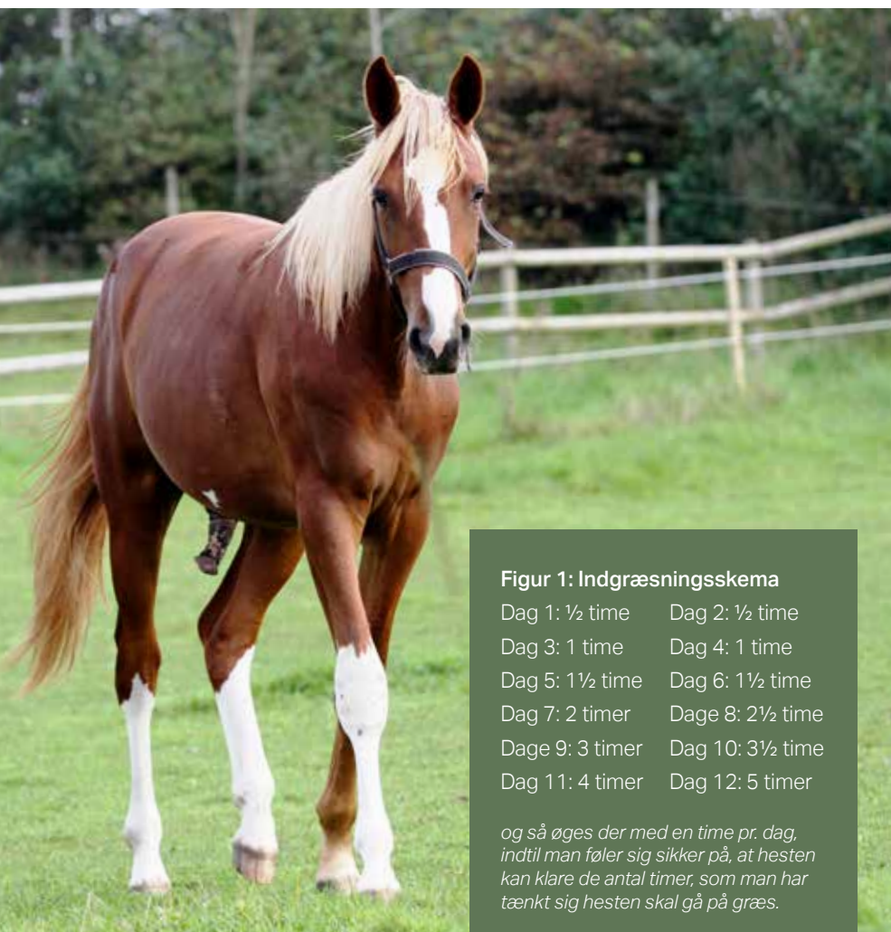
Figur 1: Indgræsningsskema

Lakterende avlshopper og heste i vækst har kun godt af alt det græs de kan spise, så længe man sørger for at dække dem ind med vitaminer og mineraler. For avlshop-