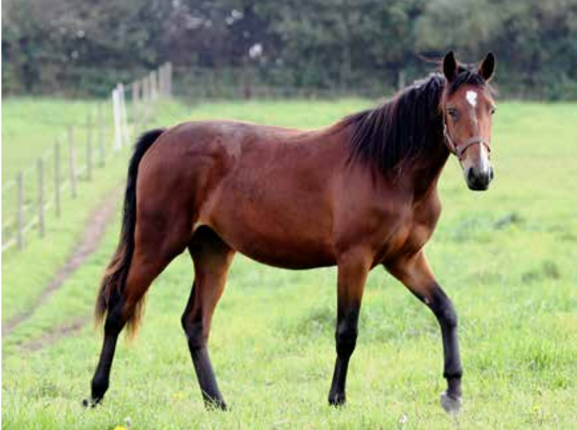
Figur 2: Hestens behov for vand