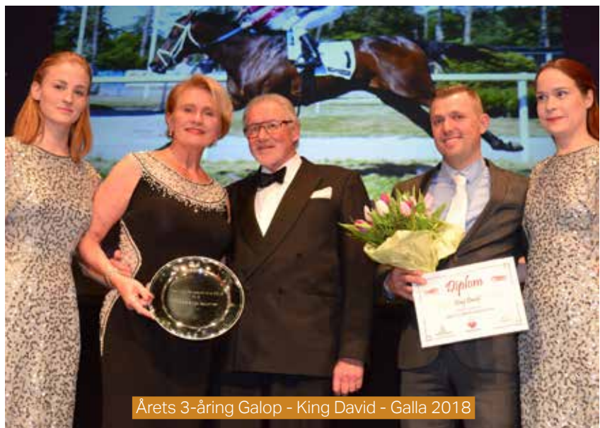
Årets 3-årig Galop - King David - Galla 2018

3-14-årige højst 57.000 kr. 2140 m. Tillæg 20 m ved 19.001 kr. Grundlag 8.501 kr. Præmier: 10.000-5.000-3.500-2.000-1.500-1.000-1.000 (7 præmier) Intet indskud.