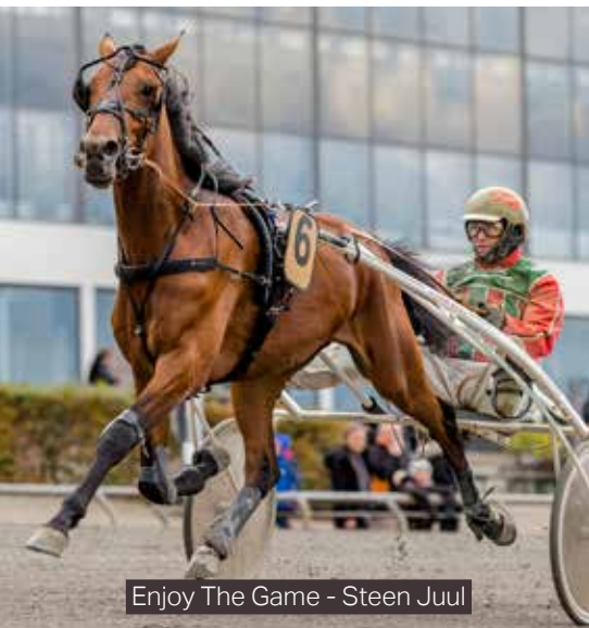
Enjoy The Game - Steen Juul

Følg os på Facebook, Instagram og www.danskhv.dk