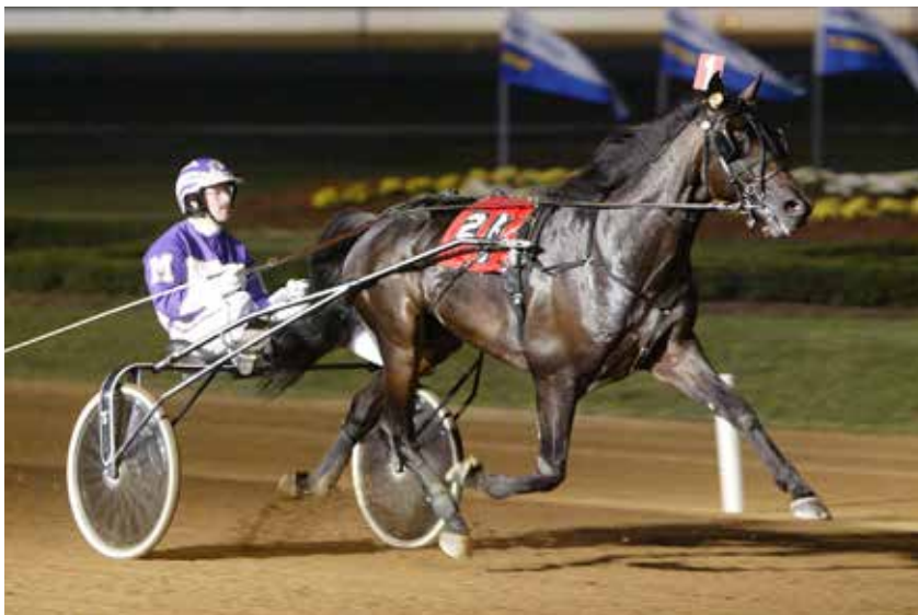
Den femdobbelte avlschampion i Danmark Great Challenger repræsenterer Garland Lobell-linjen, og som sammen med Wishing Stone, Broad Bahn og From Above U S står for godt en fjerdedel af alle bedækninger i Danmark