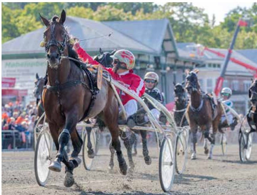
Den franske afstamning vinder også frempas i Danmark, og har set Derbyvindere i form af Axel og Bvlgari Peak (billedet). Men pris og tilgængelighed spiller ind, vurderer DTC's generalsekretær Klaus Storm.