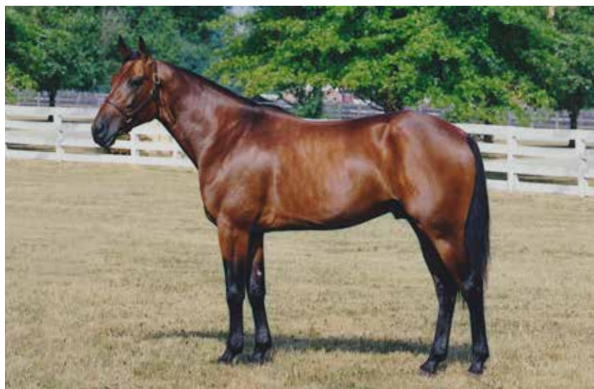
Hvor der i USA nærmest kun findes Valley Victory og Garland Lobell-linjerne, så er der en tredje i Danmark via S J's Photo. På billedet ses den succesfulde og fuldtegnede S J's Caviar.

– Vi er meget opmærksomme på, hvilke avlshingste der bruges i avlen. Det er vigtigt, at hingste avler heste med naturligt anlæg for trav, og at der er en høj startprocent, samt at de skal holde en vis kvalitet. Vi skal forsøge at højne kvaliteten ved at