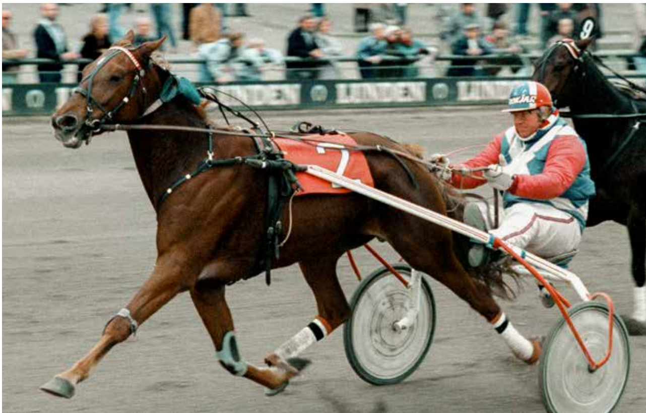
Hoppen Gå Ombord gjorde det fint på travbanen, men endnu bedre i avlsboksen som mor til blandt andre C Tøj Frøkjær, Besøg Frøkjær og On Board Frøkjær.

var svær at holde og meget ustabil, og da den havde galoperet for mig fire løb i træk, sagde jeg til Thomas at ”nu gider jeg ikke mere” – og så var det slut for mit vedkommende.