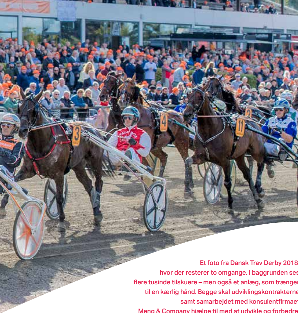
Et foto fra Dansk Trav Derby 2018, hvor der resterer to omgange. I baggrunden ses flere tusinde tilskuere – men også et anlæg, som trænger til en kærlig hånd. Begge skal udviklingskontrakterne samt samarbejdet med konsulentfirmaet Meng & Company hjælpe til med at udvikle og forbedre.

bare formuleringer, for det er klart, at man ikke bare kan score 25% af – for Lundens vedkommende – 924.858 kr. for at komme med en plan for anlægget på Traverbanevej.