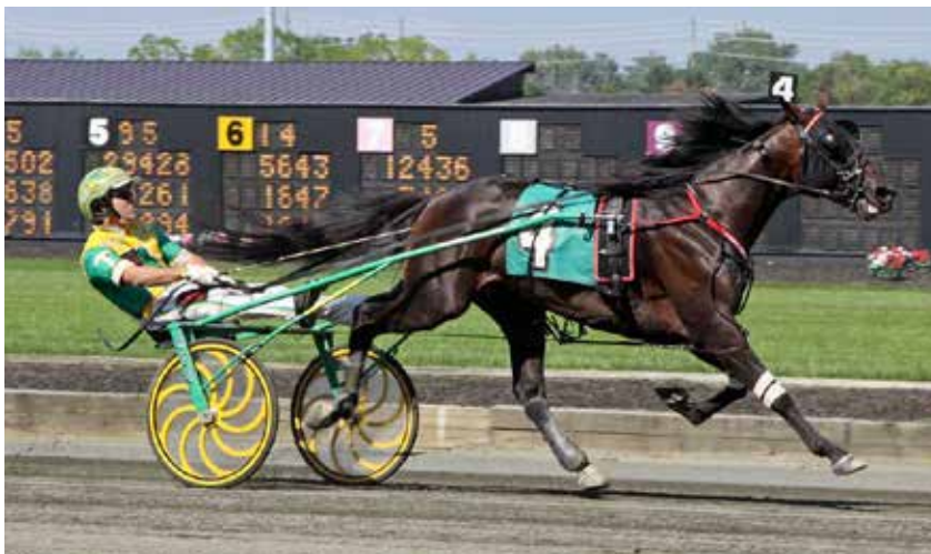
Chapter Seven repræsenterer Garland Lobell-linjen i USA med avlshingste som bl.a. Angus Hall, Andover Hall og Conway Hall. Sidstnævnte er farfar til Chapter Seven via Windsong's Legacy.

den og arbejder med at få fornyelse til landet og trække hopper til bedækning, mener Klaus Storm.