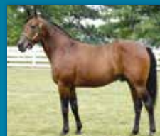
S J' CAVIAR

OPDRÆTTERFORENINGEN TILBYDER DE SIKRE VALG OG HAR SIDEN 1938 BIDRAGET TIL DANSK OPDRÆTS POSITIVE UDVIKLING.