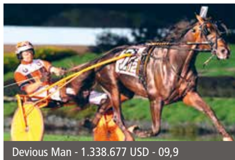
Devious Man - 1.338.677 USD - 09,9

CREDIT WINNERS afkom har tjent USD 96 mio. i Nordamerika, hvor 284 afkom har tjent mere end USD 100.000, 570 afkom har løbet under 14,6a og hele 140 afkom under 11,5a.