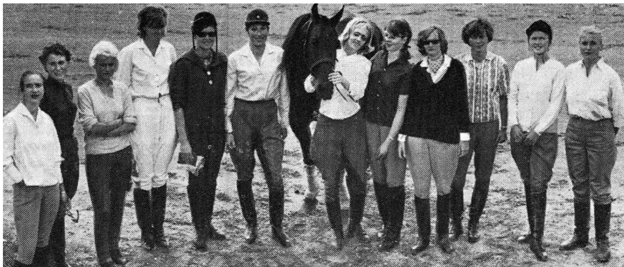
I 1963 var der ridetravløb for damer både på Amager og Charlottenlund. Det første ridetravløb havde deltagelse af 11 kvinder.