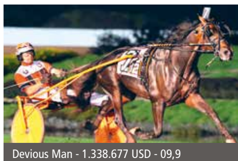
Devious Man - 1.338.677 USD - 09,9

CREDIT WINNERS afkom har tjent USD 96 mio. i Nordamerika, hvor 284 afkom har tjent mere end USD 100.000, 570 afkom har løbet under 14,6a og hele 140 afkom under 11,5a.