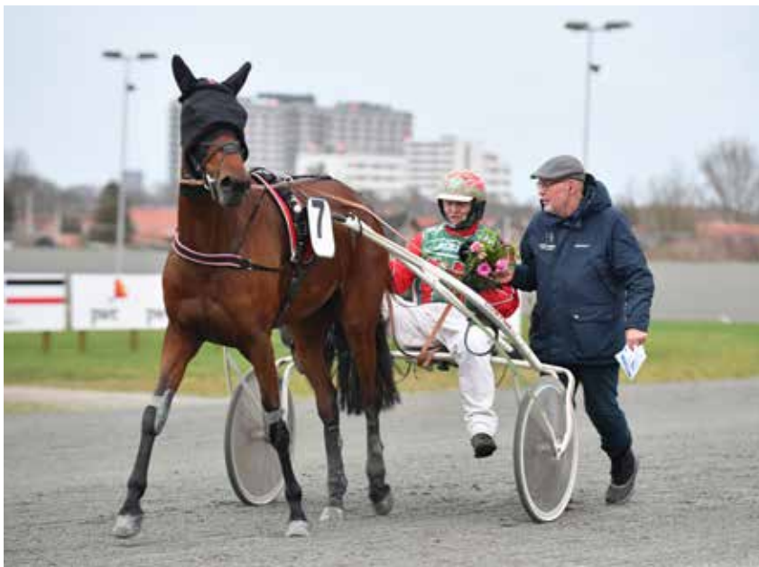
Destiny S vinder på Fyens Væddeløbsbane i Odense, hvilket var med til at gøre den til "månedens hest" i februar 2020.