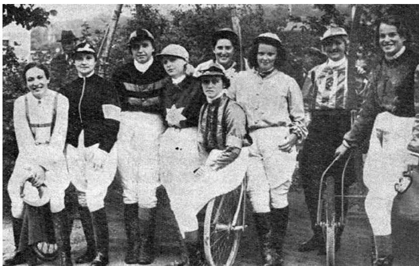
Det første officielle travløb for kvindelige kuske blev kørt i sommeren 1938. Altså 53 år efter den første registrerede væddeløbsdag i Danmark.

Derbyvinderen fra 1937, Tella The Great, deltog i dette løb i 1942, kørt af Grith Cor-