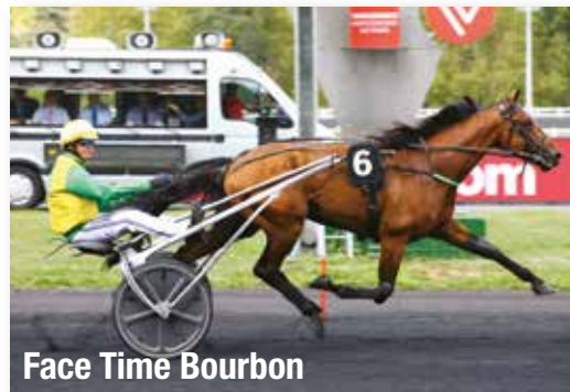
Face Time Bourbon