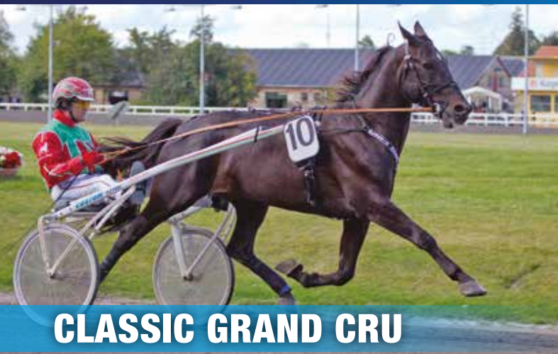
CLASSIC GRAND CRU

1.09,6 - 6,7 mio. DKK - 158 starter: 42-34-31