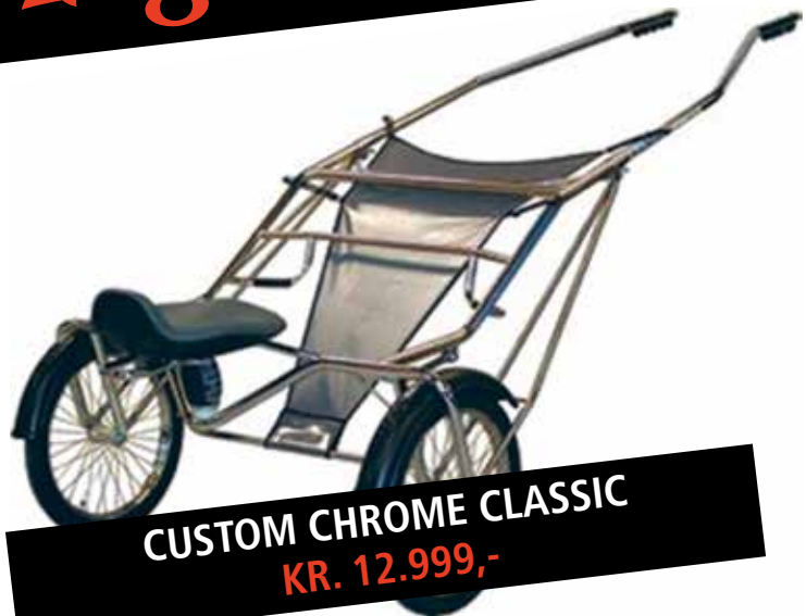
CUSTOM CHROME CLASSIC KR. 12.999,-

Prisen er med almindelige hjul med eger. Carbonhjul kan tilkøbes. Pris er inkl. sidestænger.