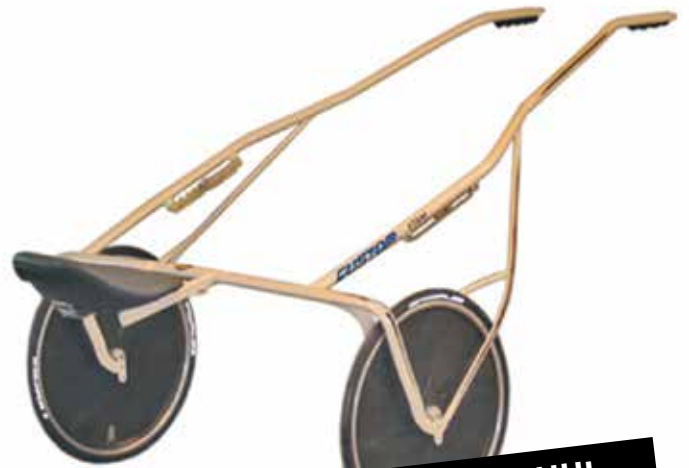
CUSTOM STAM MED CARBON HJUL KR. 36.050,-