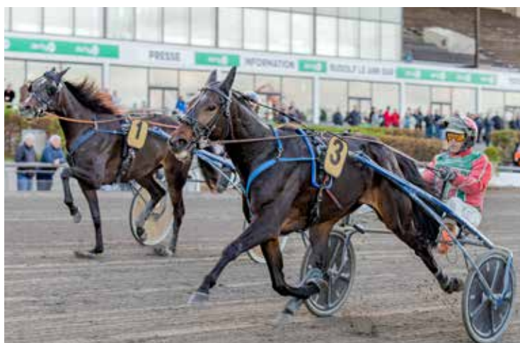
Fossa - Steen Juul

FREEZE FREIHERR FAUST FREJA FREJA BLÅBJERG FREJA GARBO FREJA HENLEY FREJA LUND FREJA ØSTERVANG FREYA D FRIDA FRIDA FRÆK FRIDAY FRISK FRITJOF S H FRK LUPO FRODO CASH FRODO VICTORY FROMAJACKTOAKING FRONTRUNNER SHADOW FROZEN DESIGN FRYGTLOS FRØKEN A P FRØKEN FIE FUEL FLAME FULTON FUN AND PARTY TALK FUNNY GARDENIA FUNNY MONEY FUTTER FUTURE FÆTTER FILUR FØNIX BOY FØNIX VANG