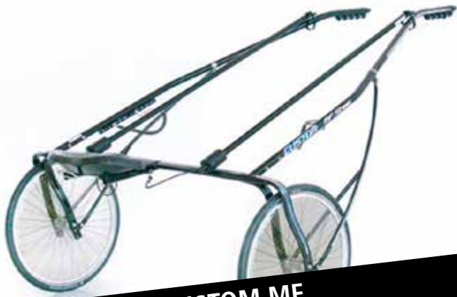
CUSTOM MF KR. 14.900,-