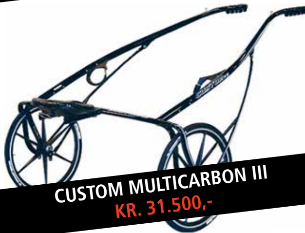
CUSTOM MULTICARBON III KR. 31.500,-

Husk at du kan købe via dit CVR-nummer. Ingen moms!