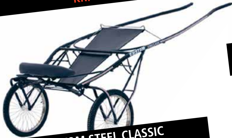
CUSTOM STEEL CLASSIC KR. 12.900,-

Husk at du kan købe via dit CVR-nummer. Ingen moms!